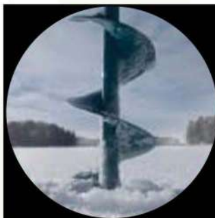
Pesca en hielo