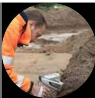
Muestreo de suelos