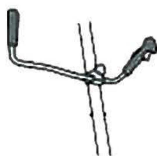
Mango plegable para fácil almacenamiento