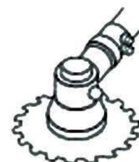
Hoja de sierra