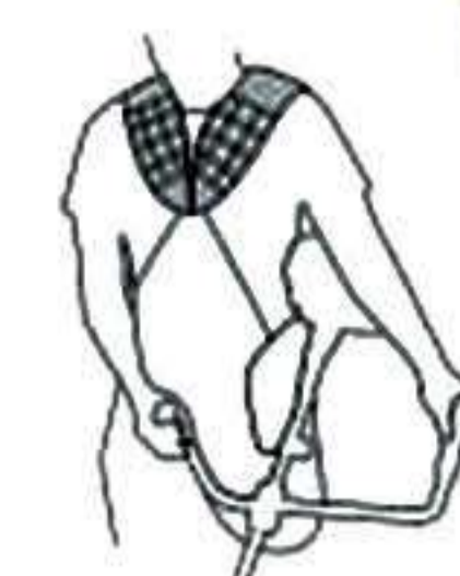
Mango y ancho Arnés para turnos largos