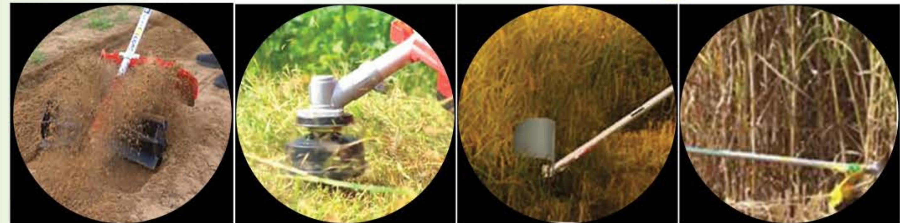
Preparación del campo